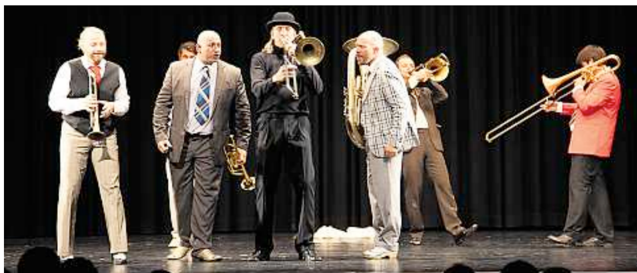
An jedem Mundstück ein Könnler: Die Gruppe Mnozil Brass – hier in Landquart – beehrt das Engadin.