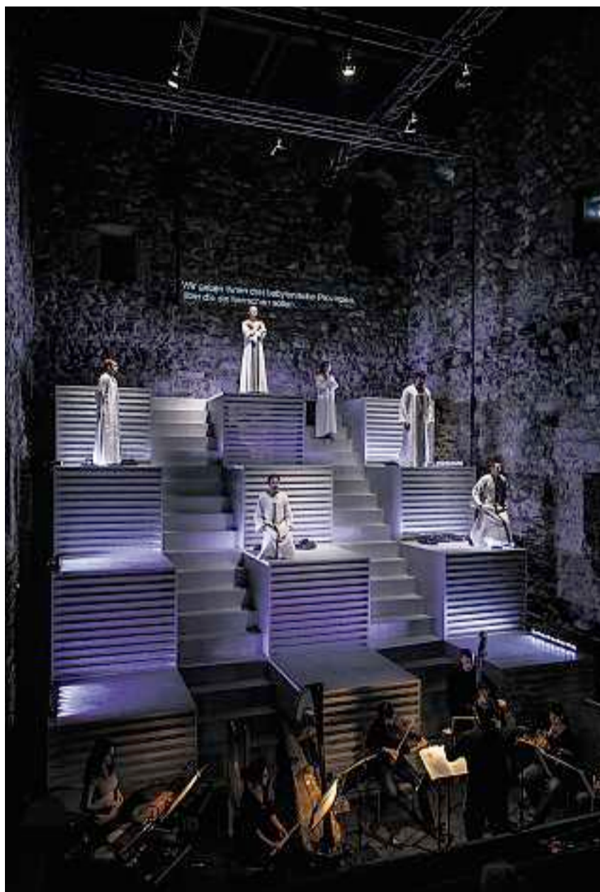
Schauspiel auf metallenen Kuben: Burg Riom ist derzeit Schauplatz von Benjamin Britten's Kirchenoper «The Burning Fiery Furnace».

Es gehört zu den Gepflogenheiten des Origen-Kulturfestivals, Jahr für Jahr ein alttestamentliches Themenfeld zu beackern – in dieser Saison das biblische Babylon. Unter den vielen Opern-Möglichkeiten entschied sich Regisseur Giovanni Netzer und der künstlerische Leiter des Festivals, Clau Scherrer, für die Inszenierung von Britten's Kirchenparabel «The Burning Fiery Furnace». Eine in mehrerlei Hinsicht kluge Wahl. Zum einen ist die Partitur für sechs Vokalsolisten und acht Musiker wie massgeschneidert, was die speziellen Bühnenverhältnisse in der Burg Riom betrifft. Zum anderen kehrt Origen mit der Jünglings-Geschichte in gewisser Weise zu seinen Wurzeln zurück. Die